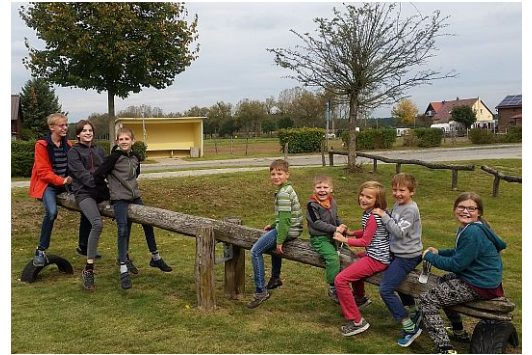
Familienkreiswochenende in Zagelsdorf

Wollen Sie auch Familienkreisen? Der Terminzettel findet sich unter http://www.konrad-kirche.de/familienkreis im Internet. Für aktuelle Informationen gibt es einen Mailverteiler. Zur Aufnahme genügt ein Anruf.